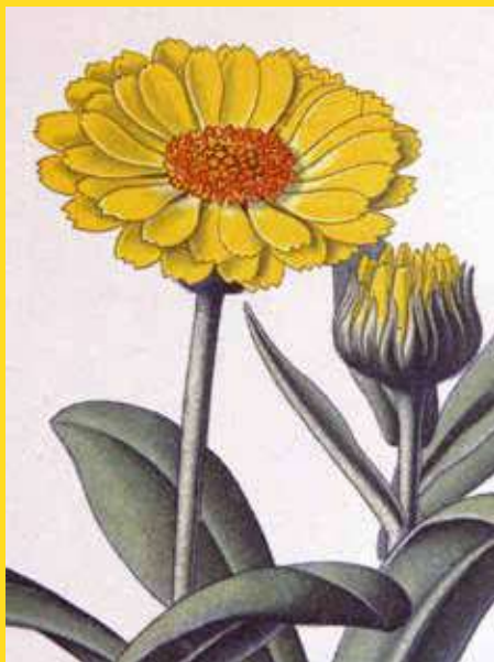
Atlas des plantes de France par A. Masclef, 1891-BMB-U630